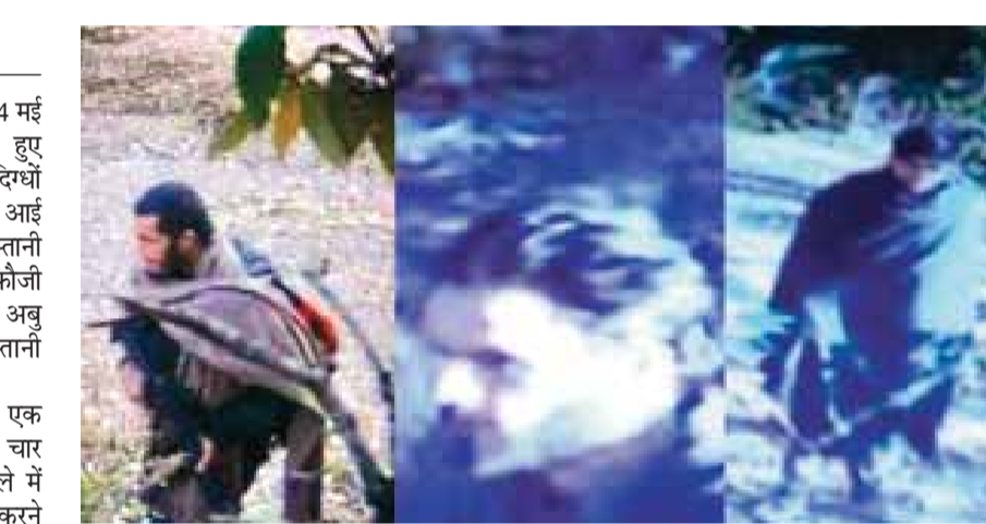
तीनों जैश कमांड के लिए काम कर रहे

कहा जा रहा है कि ये तीनों जैश कमांड के तहत काम कर रहे थे और जैश-ए-मोहम्मद के करीबी पीएफएफ के लिए हमलों को अंजाम दे रहे थे। फिलहाल उनकी पहचान की पुष्टि करने के लिए आगे की जांच चल रही है। उनका पता लगाने के लिए राजौरी-पुंछ क्षेत्र में बड़े पैमाने पर तलाशी अभियान चलाया जा रहा है। पहले ही कई संदिग्धों को गिरफ्तार किया जा चुका है और इन तीनों के साथ उनके संबंधों के बारे में पूछताछ की जा रही है। सुरक्षा बलों ने कुछ संदिग्ध गतिविधियों देखे जाने के बाद जम्मू-कश्मीर के अखनूर सेक्टर में एलओसी के पास बड़े पैमाने पर तलाशी अभियान शुरू किया है।