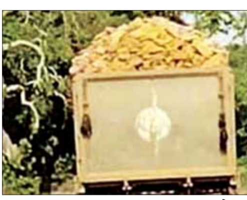
प्रदूषण से प्रभावित हो रहा क्षेत्र

सिहोरा। नगर की सड़कों पर ओवर लोड वाहन यमदूत बनकर धड़ल्ले से दौड़ रहे हैं जिसके चलते आए दिन सड़कें खून से लाल हो रही हैं। अकूत खनिज संपदा से लवरेज क्षेत्र में सक्रिय खनिज माफिया एवं परिवहनकर्ताओं की सांठगांठ से बेलगाम दौड़ते हाइवा डंपर सड़कों पर हादसों को अंजाम देने के साथ साथ शासन को राजस्व क्षति भी पहुंचा रहे हैं फिर भी जिम्मेदार महकमों द्वारा यमदूत बनकर दौड़ते इन ओवरलोड वाहनों पर लगाम कसने के बजाए उनकी अनदेखी की जा रही है।