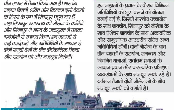
6 मई को सिंगापुर पहुंचे तीनों जहाज

समुद्र में सुरक्षा बढ़ाने के लिए भारतीय नौसेना लगातार महासागरों में गश्त कर रही है। इस बीच भारतीय नौसेना के पूर्वी बेड़े को दक्षिण चीन सागर में तैनात किया गया है। भारतीय नौसेना जहाज दिल्ली, शक्ति और किस्टन इसी तैनाती के हिस्से के रूप में सिंगापुर पहुंच गए हैं, जहां सिंगापुर गणराज्य की नौसेना के कर्मियों और सिंगापुर में भारत के उच्चायुक्त ने उनका गर्मजोशी से स्वागत किया। इन जहाजों से कई कार्यक्रमों और गतिविधियों के माध्यम से दोनों समुद्री देशों के बीच दौकालिक मित्रता और सहयोग को और मजबूती मिलेगी।